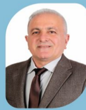
RECAYİ BÜYÜK Fotoğrafçı