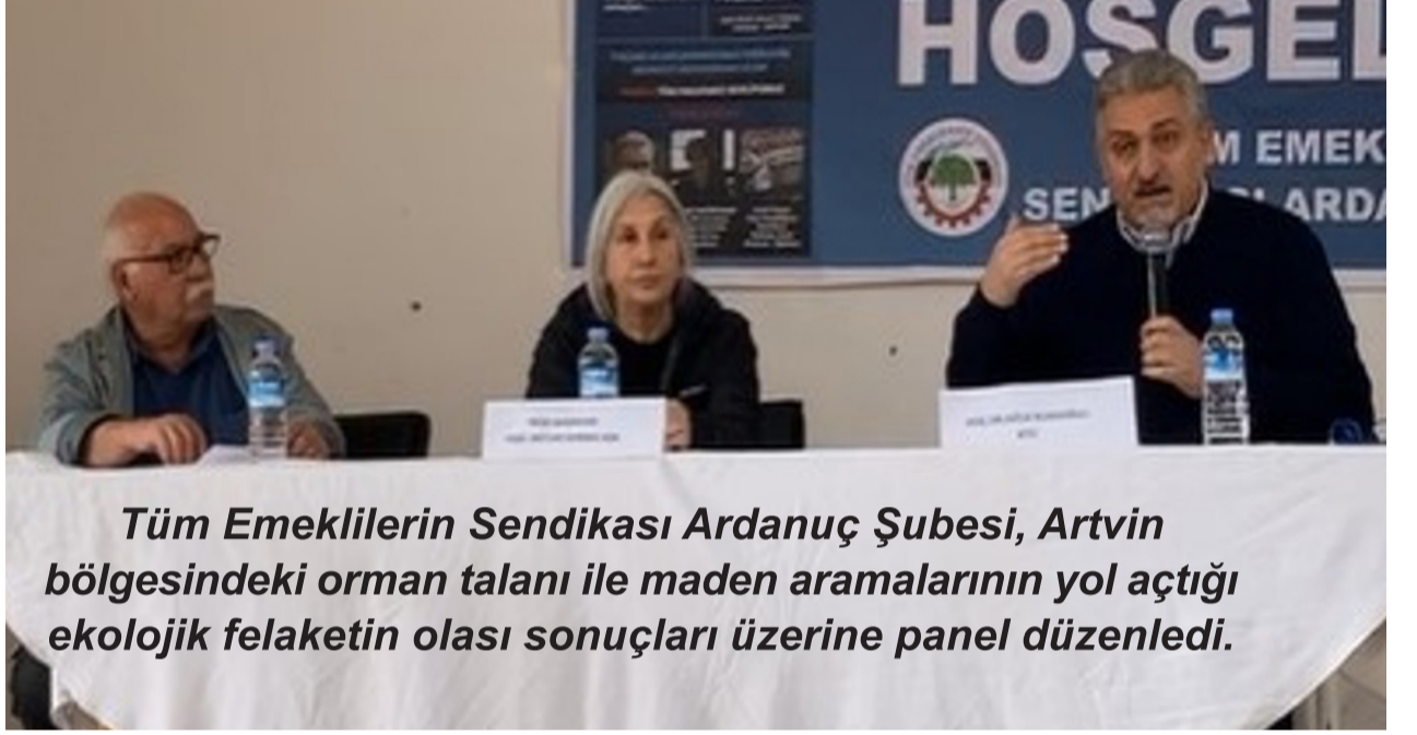
Tüm Emeklilerin Sendikası Ardanu Şubesi, Artvin bölgesindeki orman talanı ile maden aramalarının yol açtığı ekolojik felaketin olası sonuçları üzerine panel düzenledi.

alanlarımızı maden sahası haline getirmeye çalışıyorlar. Artvin'in yüzde 72'si madene ipotek edilmiş vaziyette. Biz ilk defa ormanlarla ve madenlerle ilgili panel düzenledik. Bu panelde tüm Ardanuların yer aldığı panel oldu. Ormanların katledilmesi burada yaşayan herkesi ilgilendiriyor. Biliyorsunuz ki Türkiye'de ormanlar ya kesiliyor ya da yakılıyor. Sebebi ise rant sağlamak için. Ardanu'ta da her yıl yüz metreküp ağacımız kesiliyor. Kesilen ağaçlar Gürcistan'a götürülüyor. Bizim ağacımızı, bizim