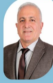
RECAYİ BÜYÜK Fotoğrafçı